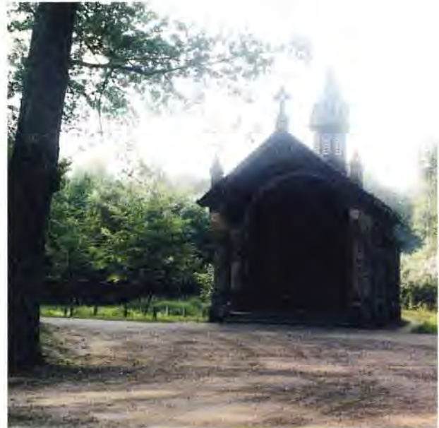
Tervuren, St. Hubertuskapel.

eik gesneden. De middeleeuwse mysticus Ruusbroec zocht in Groenendaal de eenzaamheid op en schreef zijn teksten neer onder een linde. Geneeskrachtige bronnen borrelen in dit waterrijk gebied. Om nog maar te zwijgen over Sint Hubertus, van oudsher aangeroepen tegen hondsdolheid, aan wie rond het jaar 700 recht tegenover café 'Het Hoefijzer' in het huidige Tervuren, een reusachtig hert met een schitterend kruis verscheen. Naar Hubertus en de dronken hond verwijst ook nog het onlangs gesloten café in Overijse, 'De Wildeman', naar 't schijnt uitgebaat door de laatste afstammelingen van de Brusselse ketterin Bloemardinne, tijdgenote van Jan van Ruusbroec, die er