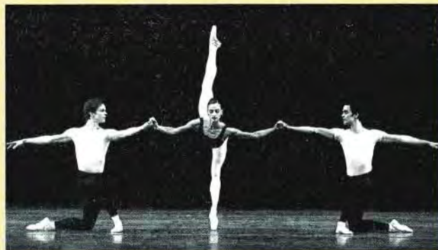
'Agon', choreografie van George Balanchine

In het programma van dit jaar voeren solovoortellin-