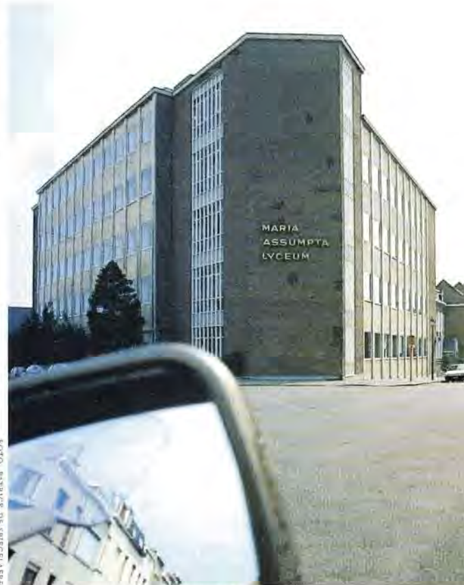
Het Maria-Assumpta college in Laken

(Cijfers: Vlaamse Gemeenschaps Commissie, telling februari '97).