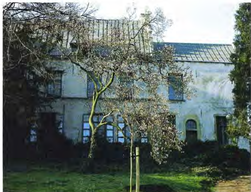
Het geboortehuis van Justus Lipsius in Overijse