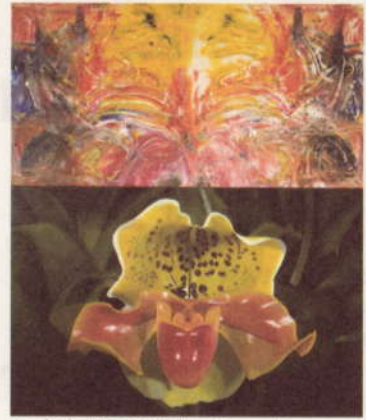
Orchid, 1996, Colin Crumplin

De Britse schilder Colin Crumplin schildert in etappes. Figuratieve en abstracte kunst hoeven volgens hem niet elkaars tegenpool te zijn. Crumplin (52) bedacht een methode om beide op een originele manier te combineren. Eerst verdeelt hij zijn doek in twee helften. Met de blote hand brengt hij links of rechts van de scheidingslijn, ongeordend en zonder vooropgesteld doel, acrylverf aan. Daarna plooit hij het doek en legt het ingekleurde gedeelte even op het maagdelijke. De afdruk of de monoprint die hieruit ontstaat, wordt grondig geanalyseerd. Net als bij de Rorschachtest duiken herkenbare structuren of patronen op, die geassocieerd kunnen worden met beelden uit de werkelijkheid. Vervolgens schildert Crumplin die beelden -dat kunnen voorwerpen of landschappen zijn- zo realistisch mogelijk op een tweede luik, dat even groot is als het inspirerende model. Om de realiteit zo haarfijn mogelijk weer te geven doet hij soms een beroep op de fotografie of op illustraties uit boeken of tijdschriften. Chaotische vegen en spontane sporen van de vuist, de vingers, of de handpalm krijgen hier plots een betekenis. In feite onder-