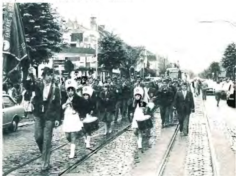
31 juli 1978, de laatste tramtocht in Wemmel

De vzw Pro Tram publiceert in het najaar het boek 'Van Eigenbrakel naar Waver' in de tijd van de Buurtspoorwegen. In 1999 komt een lijvig boek uit over de tramlijn Brussel-Humbeek en de nevenlijnen. Voor meer informatie kan men terecht bij de vzw Pro Tram, Dokter Hemeerijkxlaan 1, 1850 Grimbergen.