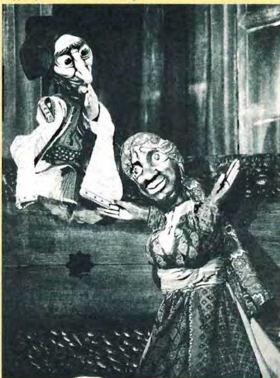
Poppenspel 'Alibaba en de Veertig Rovers'

Der Prager Frühling von 1968 und die 'sanfte Revolution' von 1989 förderten ohne jeden Zweifel den europäischen Einigungsprozess. Nach vierzig Jahren der Isolation hofft Tschechien jetzt, Vollmitglied in der Nato und in der Europäischen Union zu werden. Mit Ausstellungen, Konzerten, Theatervorstellungen und anderen künstlerischen Manifestationen rückt das Kunstfestival Europalia in den nächsten Monaten Tschechien in den Mittelpunkt. Dabei liegt die Betonung auf den historischen Banden zwischen den verschiedenen europäischen Völkern und auf der weltweiten Ausstrahlung der böhmischen Kultur.