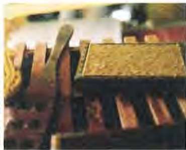
STEFANO VLAH - GAZZETTA