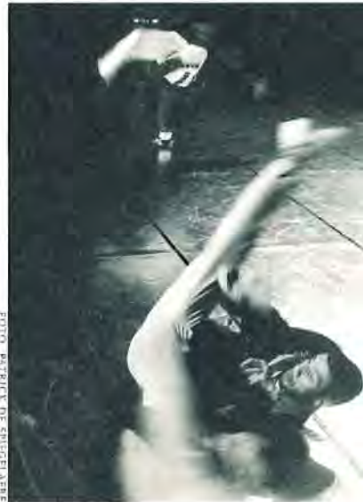
Hush hush hush via

ver Koen Augustijnen beperkt zich niet tot podiumproducties, maar fungeert vooral als raadsman op verschillende fronten. De meeste dansers zijn afkomstig uit de anarchistische, polyvalente school van Alain Platel die