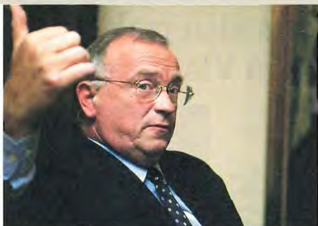
Luc Van den Brande

■ Het stoort me zeer hoe Vlaanderen door sommige Franstaligen in het buitenland in het verdomhoekje wordt geplaatst. Op den duur zouden de Vlamingen nog zelf gaan geloven dat we ondemocratische lieden zijn. (minister-president Luc Van den Brande in De Standaard )