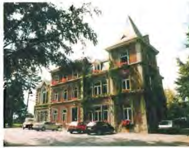
Het Gemeentehuis van Marche-en-Famenne