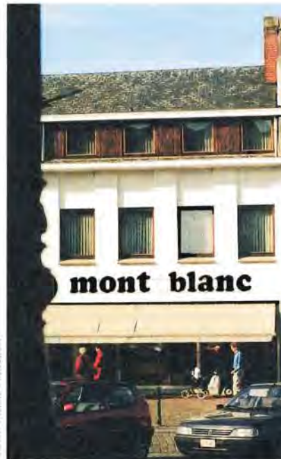
Het geboortehuis van Dotremont

hier één van de gangmakers van Cobra heeft gewoond. Die aanklacht is me altijd bijgebleven en daarom nemen we nu, 50 jaar nadat Cobra werd gesticht, de gelegenheid te baat om iets rond Dotremont te doen. De