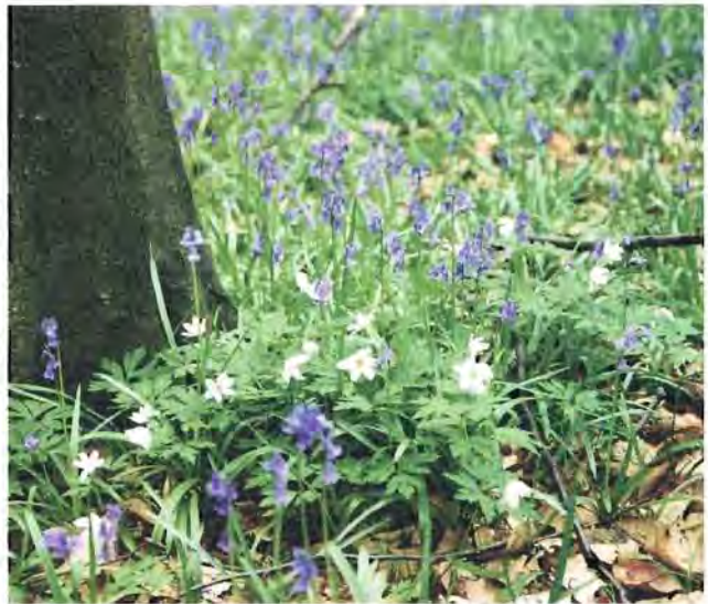
Boshyacinten en bosanemonen

Een groot probleem blijft tenslotte het ontstellend gebrek aan respect voor de natuur. Wandelaars weten nog altijd niet dat in Vlaamse bossen niets geplukt mag worden (geen narcissen,