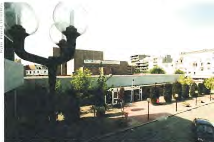
Het cultureel centrum van Strombeek