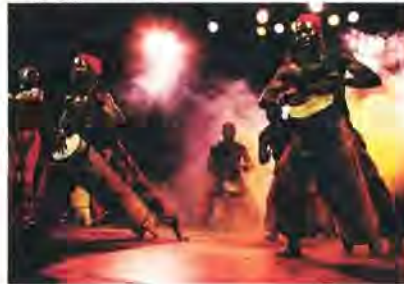
Tambours de Brazza

schotelen (zie Figuranten p. 10 en 11). Naast de muziek is er ook veel randanimatie; Afrikaanse haarkunstenaars vlechten in het openlucht dorp het gewenste rastakapsel, terwijl leraars in een voor de gelegenheid opgetrokken Cocodyschooltje kinderen en volwassenen de basisbegrippen van de Swahilitaal bijbrengen. Tussen de Arabische souks en de Indianenmarkt wordt in de Cantina Mundial exotisch getafeld! En natuurlijk zijn er ook de vaste waarden zoals tentoonstellingen, performances, breakdancers, marching bands en vuurwerk.