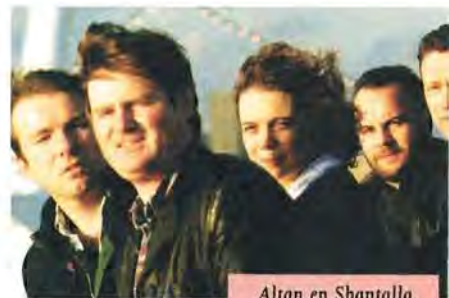
Altan en Shantalla