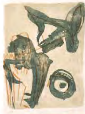
Lithografie van Marie-Louise Sleecx

sprakeloos, kinderen (6-8) die bewegen i.p.v. praten om iets duidelijk te maken. Fysiek spel o.l.v. jeugdinst Mooss. Drie woensdagen: 13/20 en 27 okt 🕒 14.00-17.00