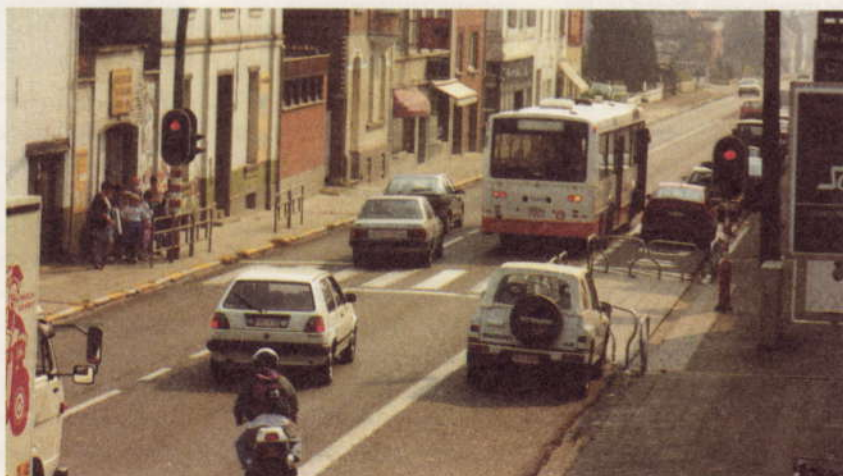
Auto's door het rode licht op de Brusselse Steenweg in Jezus-Eik.