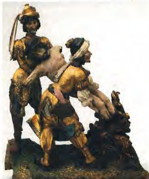
Adrianusretabel, detail van de brandstapel na de behandeling

den getransporteerd voor een tentoonstelling, werd door Brussel 2000 een route uitgestippeld langs de kijkplaatsen. Ook verscheen een gids met uitleg over deze beeldhouwde altaarstukken met beschilderde luiken. In het kasteel van Gaasbeek wordt in het middenpaneel de bewening van Christus uit het passieverhaal voorgesteld. De zijluiken verwijzen naar de kruisafneming en de graflegging. De beelden verkeren nog in goede staat, maar zijn met geel vernis bedekt waardoor de oorspronkelijke kleurtinten verloren gaan.