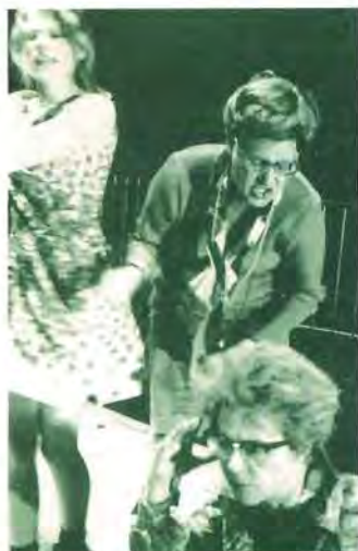
Ronde van Vlaanderen, op 28 maart in CC Westrand in Dilbeek