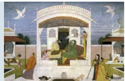
Expo 'Nala-Damayanti - geschilderde miniaturen' (tot 10/12/2007)

Ook yoga is wijd verspreid. Deze gecompliceerde zithouding is nog ouder dan de religies. 'Archeologen ontdekten oeroude stenen tabletjes waarop dieren en goden met de voetzolen omhoog worden afgebeeld. India is trouwens een levend museum. Van haast elke periode zijn geloofsovertuigingen en praktijken blijven bestaan.'