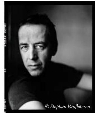
Braakland/Zhebildung op 26 oktober in Jezus-Eik

Lied door Braakland/Zhebildung GC de Bosuil, Witherendreef 1, Jezus-Eik 02-657 31 79