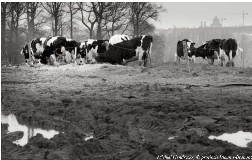
Michiel Hendryckx, © provincie Vlaams-Brabant

Het boek Brussel en de Vlaamse Rand, een verhaal van migraties en grenzen van Petra Gunst kost 20 euro (excl. verzendingskosten). Op 15 mei wordt het boek voorgesteld in GC de Zandloper in Wemmel.