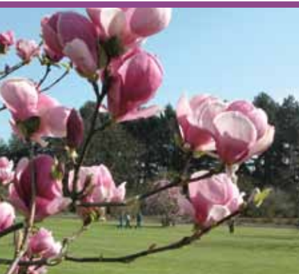
Magnoliawandeling (t.e.m. 30/4)

De agenda wordt samengesteld met gegevens uit de UiTdatabase. Organisaties en verenigingen die hun activiteiten opgenomen willen zien in de volgende agenda die de periode van 1 tot en met 31 mei bestrijkt, moeten ons de nodige informatie bezorgen voor 1 april a.s. Je kunt de gegevens mailen naar randkrant@derand.be , per brief sturen naar ons redactieadres (RandKrant - UiT in de Rand Agenda, Kaasmarkt 75, 1780 Wemmel) of invoeren in de UiTdatabase via www.uitdatabase.be . Gezien het beperkte aantal beschikbare pagina's wordt bij de aankondigingen prioriteit verleend aan de activiteiten in de gemeenschaps- en cultuurcentra in de Rand. Om voor plaatsing in aanmerking te komen, worden de andere activiteiten vooral beoordeeld op hun uitstraling naar alle inwoners van de Rand. Het volledige vormingsaanbod van Arch'educ vind je op www.archeduc.be .