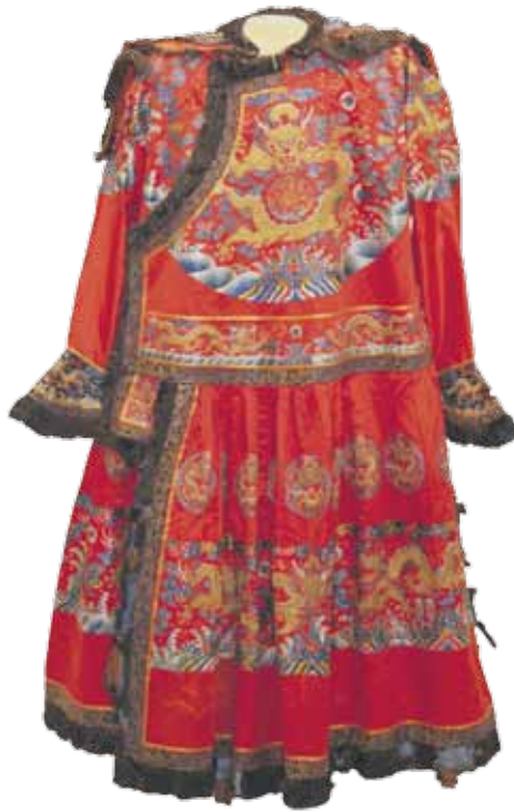
Jiaqing © PALACE MUSEUM