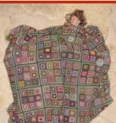
Kind aan huis (17/10)