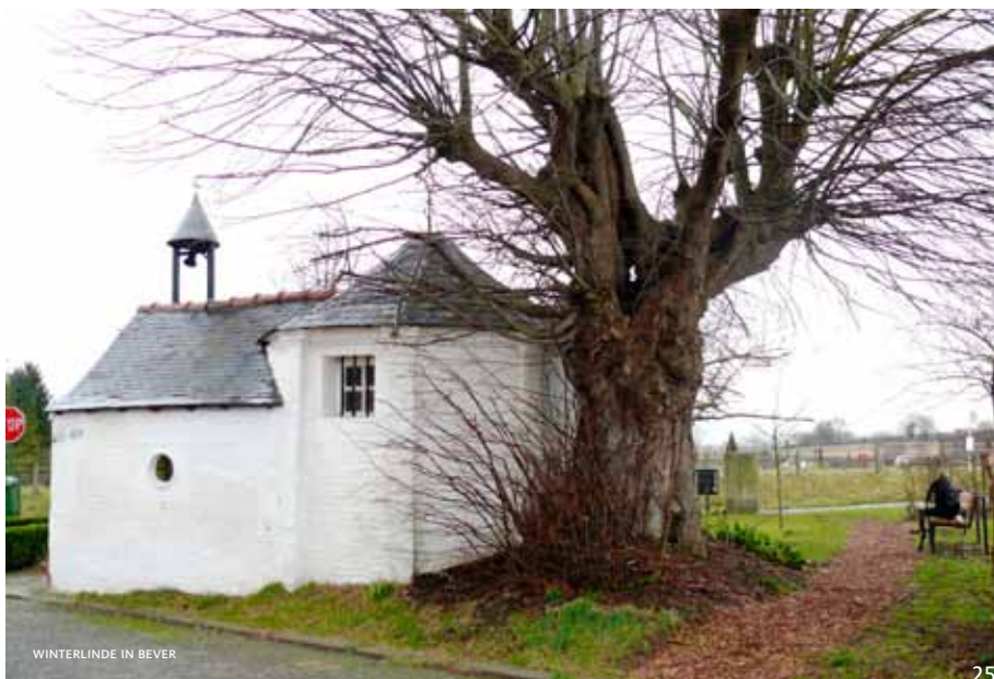
WINTERLINDE IN BEVER

Samen met de herwaardering van onder meer het domein Drie Fontein en het Tangbeekbos kaderen de onderhoudswerken van het Prinsbos in het project Van basiliek tot basiliek , een meer dan acht kilometer lange, groene wandeling tussen de Basiliek van Troost in Vilvoorde en de Basiliek van Grimbergen. Het traject is nog niet volledig afgewerkt, maar zal vermoedelijk aan elkaar sluiten in de loop van de komende jaren. Alle deelgebieden zijn intussen opgeknapt en gratis te bezoeken.