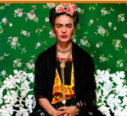
Frida Kahlo y su mundo (tot 18/04)

De agenda wordt samengesteld met gegevens uit de Uitdatabank. Organisaties en verenigingen die hun activiteiten opgenomen willen zien in de volgende agenda die de periode van 1 tot en met 31 december bestrijkt, moeten ons de nodige informatie bezorgen voor 27 oktober a.s. Je kunt de gegevens mailen naar randkrant@derand.be , per brief sturen naar ons redactieadres (RandKrant – UIT in de Rand Agenda, Kaasmarkt 75, 1780 Wommel) of invoeren in de Uitdatabank via www.uitdatabank.be . Gezien het beperkte aantal beschikbare pagina's wordt bij de aankondigingen prioriteit verleend aan de activiteiten in de gemeenschaps- en cultuurcentra in de Rand. Om voor plaatsing in aanmerking te komen, worden de andere activiteiten vooral beoordeeld op hun uitstraling naar alle inwoners van de Rand. Het volledige vormingsaanbod van Arch'educ vind je op www.archeduc.be .