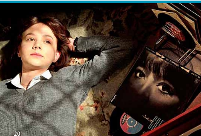
Storie Italiana (1 tot 9/05)