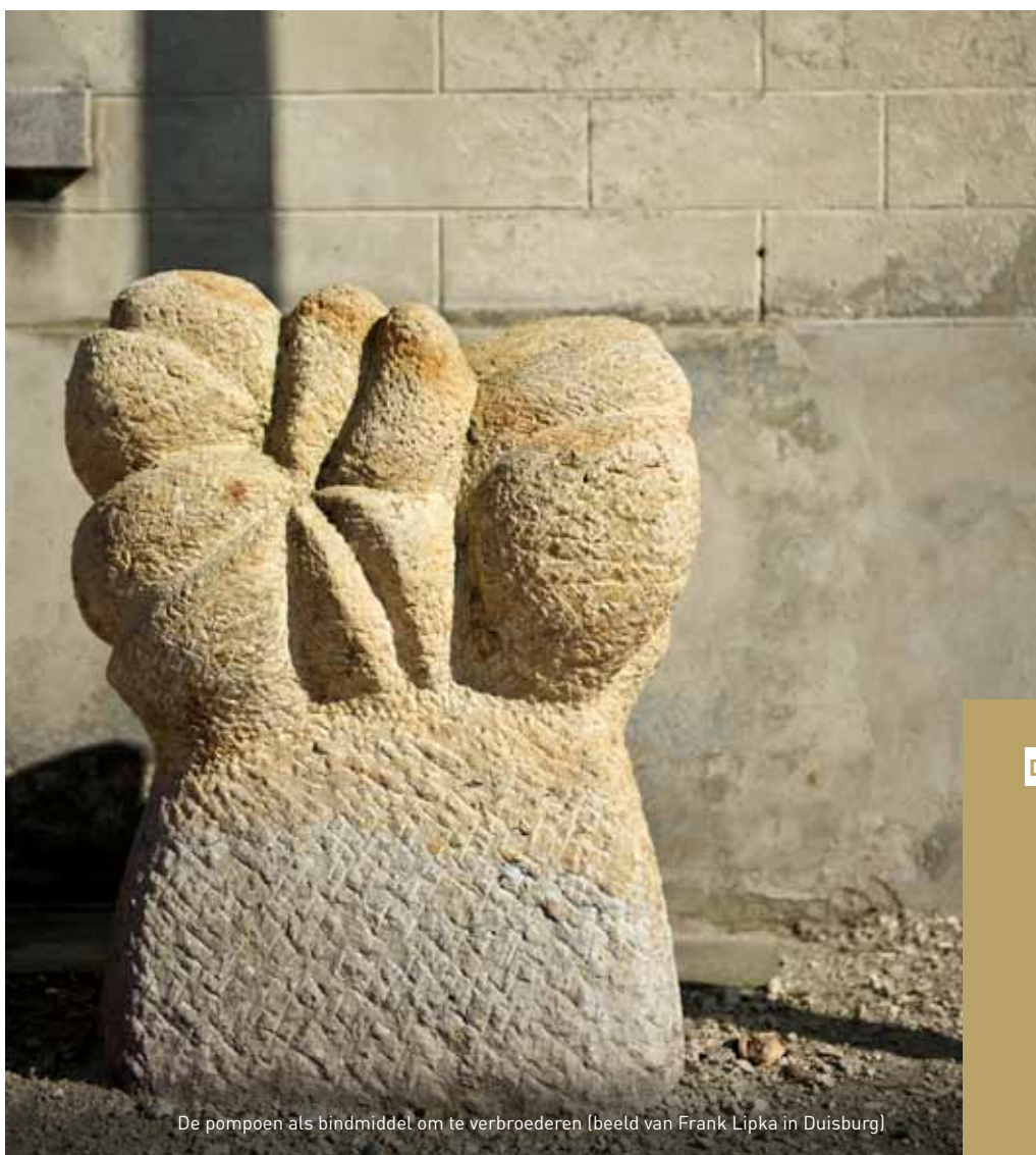
De pompoen als bindmiddel om te verbroederen (beeld van Frank Lipka in Duisburg)

Tientallen andere Tervurenaren zijn dat eveneens geworden, want de verschillende uitwisselings- en verbroederingsoorkonden volgden elkaar in snel tempo op. Tervurenaren over-