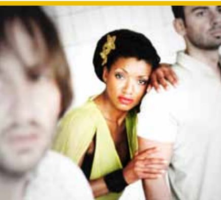
Das Pop op Hee Tervuren (1 tot 4/07)