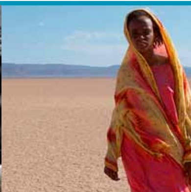
Desert Flower (15/06)