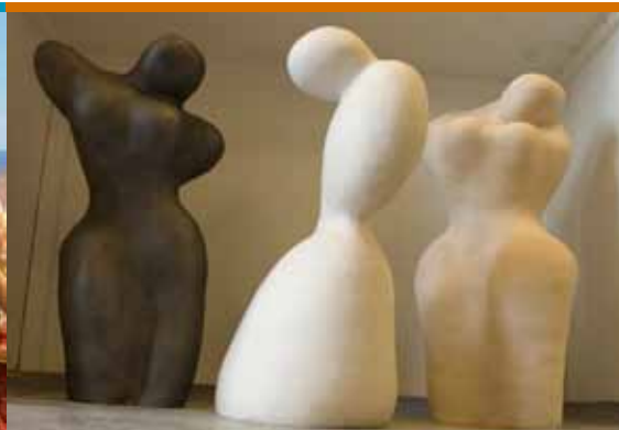
Eindejaarstentoonstelling BKO (19/06 tot 1/07)