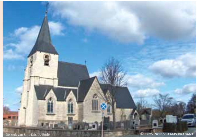
De kerk van Sint-Brixius-Rode.

i Op een kier. Verborgene erfgoed in Vlaams-Brabant vindt plaats op 20 juni en 18 juli, van 14 tot 18 uur, tenzij anders vermeld. Meer informatie vind je op www.vlaamsbrabant.be . De brochure kan je downloaden via www.mediateek.vlaamsbrabant.be . Daar vind je ook de lijst met orgelconcerten.