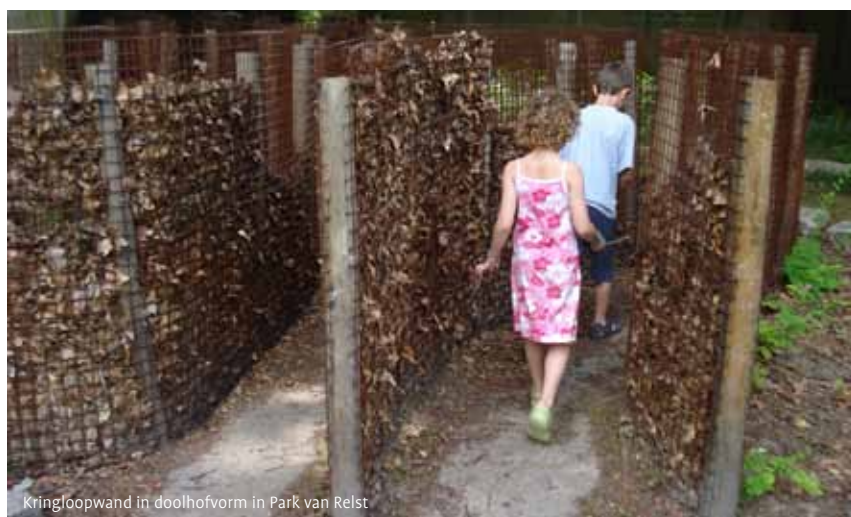
Kringloopwand in doolhofvorm in Park van Relst

i Op de website van de provincie kun je een aantal brochures downloaden over kringlooptuinen, composteren, mulchmaaien, mulchen, verhakselen, het verwerken van tuinafval, enzovoort: www.vlaamsbrabant.be/kringlooptuinieren . Plant uw tuin vol vrije tijd is het thema van Juni Compostmaand 2010. Meer info: www.compostmeester.be