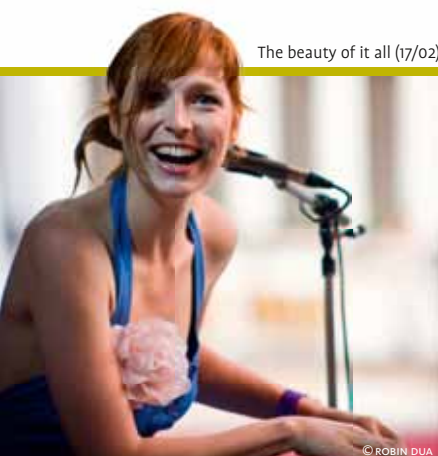
The beauty of it all (17/02)

Trio Farfalle+ Wemmel, GC de Zandloper, 02 460 73 24