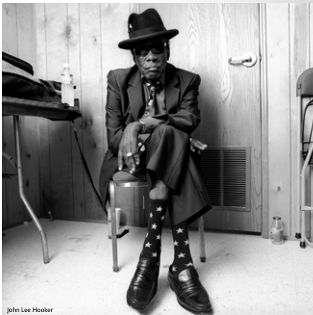
John Lee Hooker