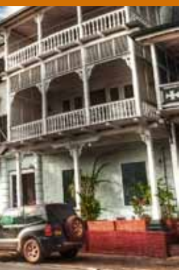
Saint Amour (12 en 14/2)