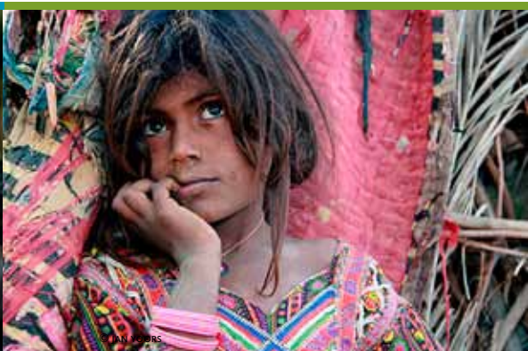
Gujarat, onbekend India (6/02)

De agenda wordt samengesteld met gegevens uit de Uitdatabank. Organisaties en verenigingen die hun activiteiten opgenomen willen zien in de agenda, moeten ons hun informatie anderhalve maand voor het verschijnen ervan bezorgen. Je kunt de gegevens mailen naar randkrant@derand.be , per brief sturen naar ons redactieadres (RandKrant – UIt in de Rand Agenda, Kaasmarkt 75, 1780 Wemmel) of invoeren in de Uitdatabank via www.uitdatabank.be . Gezien het beperkte aantal beschikbare pagina's wordt bij de aankondigingen prioriteit verleend aan de activiteiten in de gemeenschaps- en cultuurcentra in de Rand. Om voor plaatsing in aanmerking te komen, worden de andere activiteiten vooral beoordeeld op hun uitstraling naar alle inwoners van de Rand. Het volledige vormingsaanbod van Arch'educ vind je op www.archeduc.be .