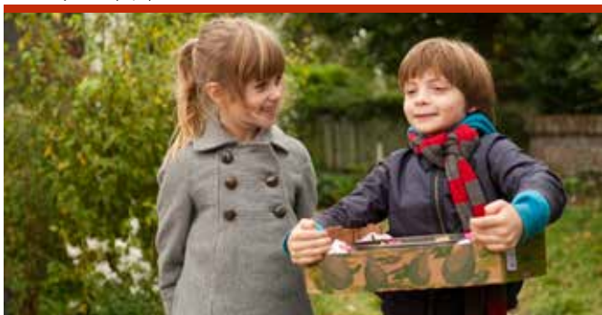
Brammetje baas (03/11)