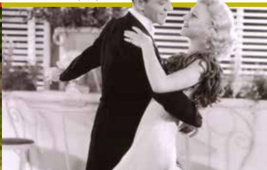
Tribute to Cole Porter (08/11)