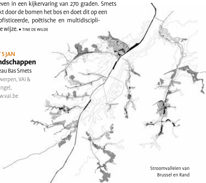
Stroomvalleien van Brussel en Rand

Bureau Bas Smets Antwerpen, VAI & deSingel, www.vai.be