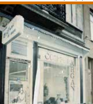
Eetcultuur in de 19e en 20e eeuw (13/12)