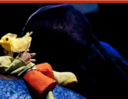
Peter en d wolf (15/12)