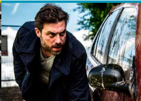
De Behandeling (13/05)