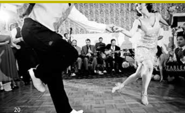
Rebirth Collective (10/05)