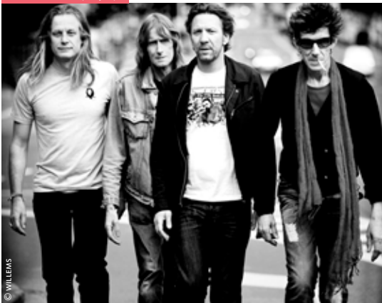
THE SCABS (26/5)