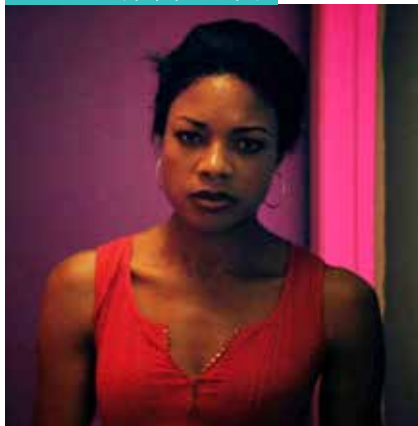
MOONLIGHT (3/5, 9/5 & 28/5)