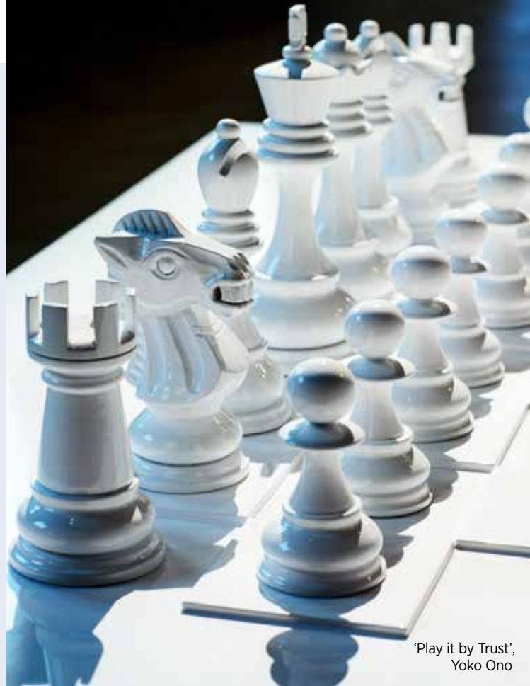
'Play it by Trust', Yoko Ono

Gaasbeek, kasteel van Gaasbeek, www.kasteelvangaasbeek.be