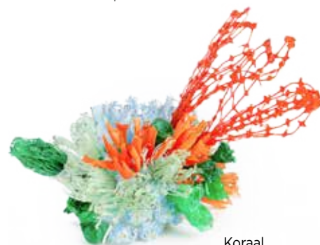
Koraal van G. Rizzi

Dworp, Destelheide, www.festivalspot-on.be