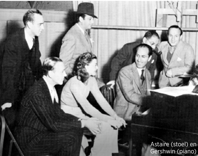
Astaire (stoel) en Gershwin (piano)