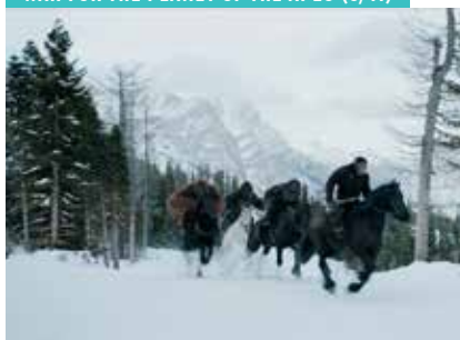
WAR FOR THE PLANET OF THE APES (5/11)