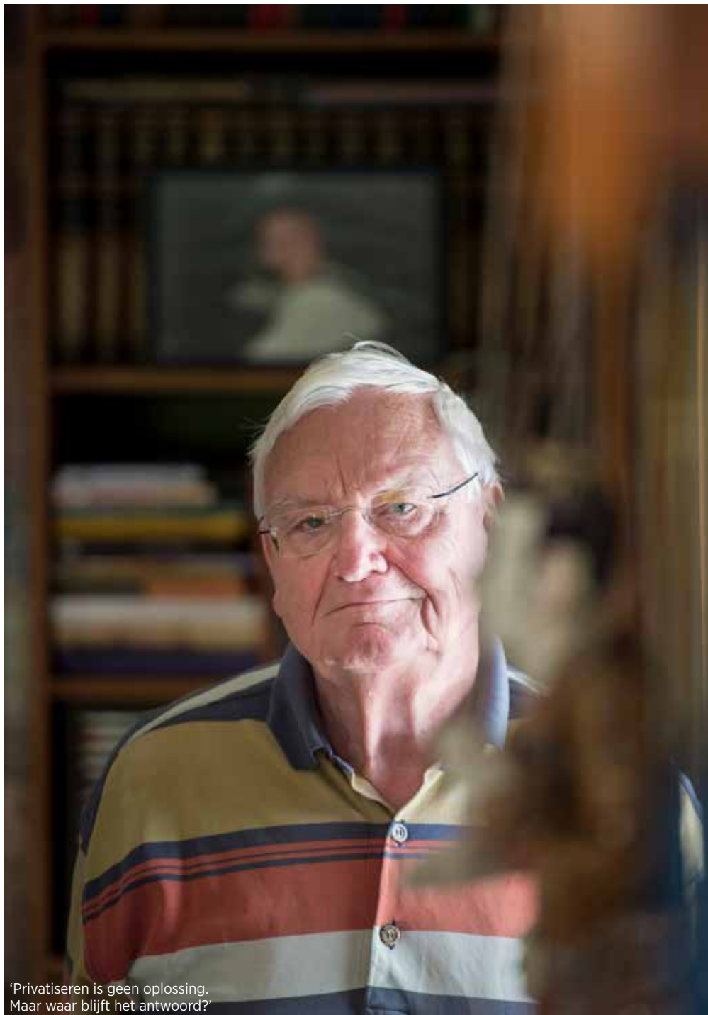
'Privatiseren is geen oplossing. Maar waar blijft het antwoord?'