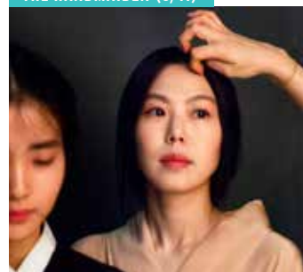
THE HANDMAIDEN (6/11)