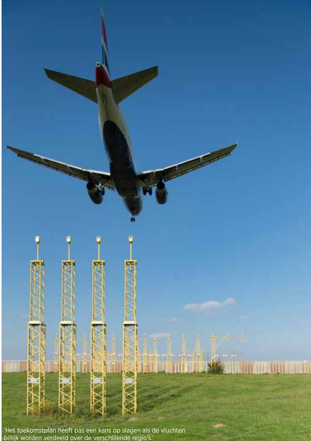
'Het toekomstplan heeft pas een kans op slagen als de vluchten billijk worden verdeeld over de verschillende regio's.'

In haar brief pleit het Vlaams-Brabantse Platform Luchthavenregio voorts 'voor meer tijd