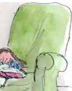
WIM HELSEN (9 EN 10/11)