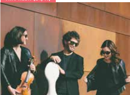
TRIO ALBA (24/11)