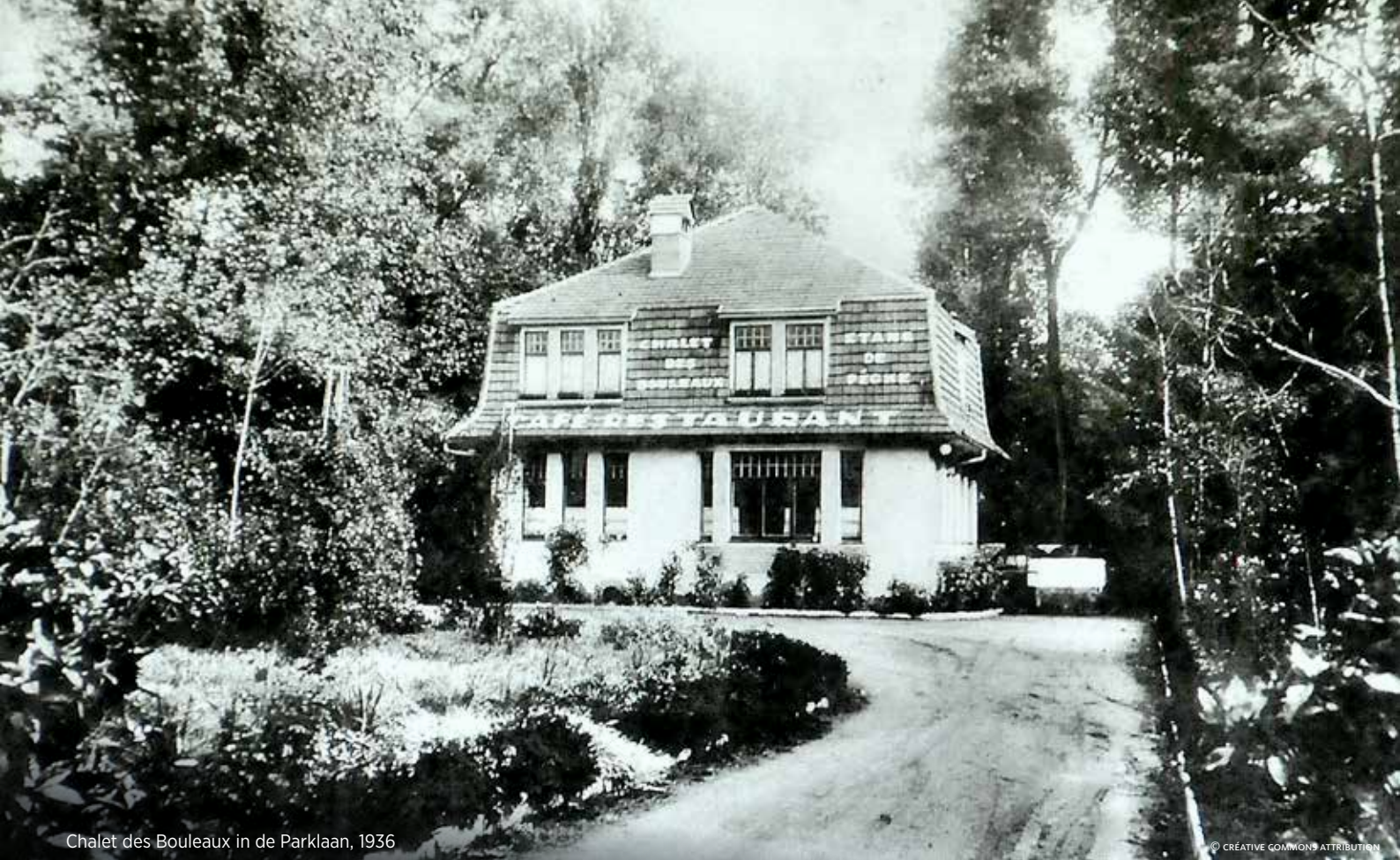
Chalet des Bouleaux in de Parklaan, 1936