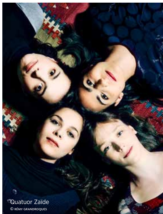
Quatuor Zaïde

Festival van Vlaanderen daguitstap Leuven Zaventem, CC De Factorij, 02 307 72 72 Grimbergen, CC Strombeek, 02 263 03 43