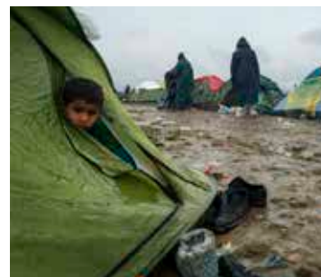
THE FLORIDA PROJECT (27/3)