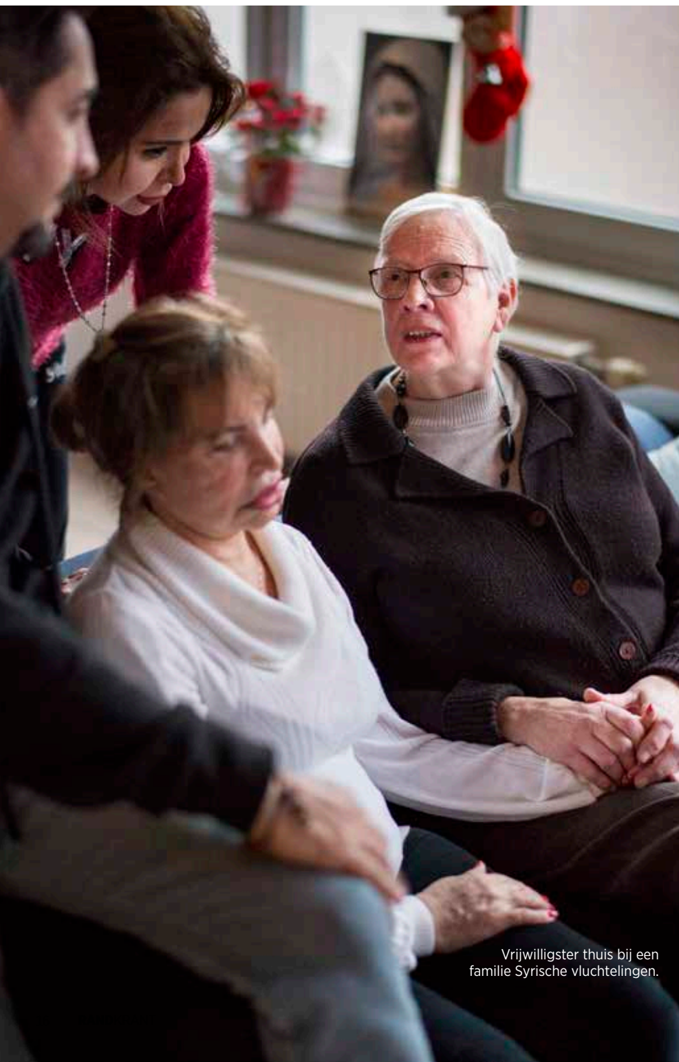
Vrijwilligster thuis bij een familie Syrische vluchtelingen.

'De Herberg kent een tweeledige werking', legt De Bisschop uit. 'Enerzijds het buddyproject, waarbij we vluchtelingen die pas in onze gemeente zijn komen wonen, proberen te ondersteunen. Anderzijds kunnen we ook op vrijwilligers rekenen die instaan voor de praktische zaken, zoals hulp bij een verhuis of het bestuderen van nieuwe wetgeving of regels. De buddy's kunnen ervaringen uitwisselen en we kunnen bij professionele organisaties