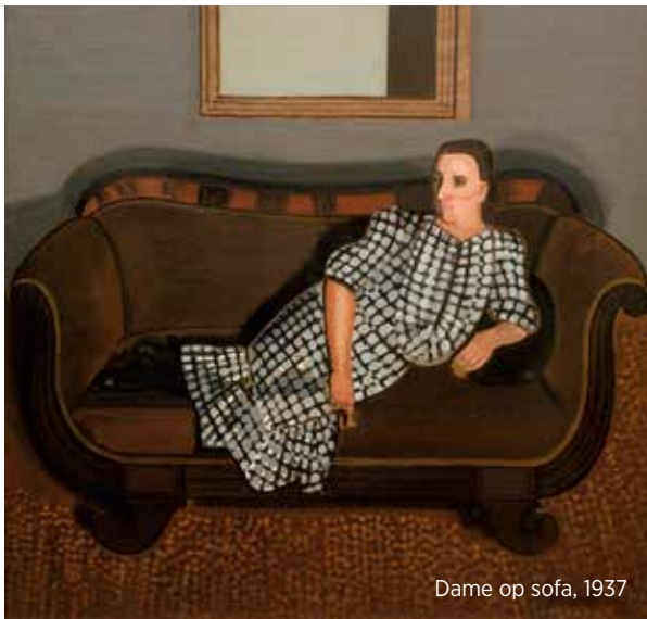
Dame op sofa, 1937