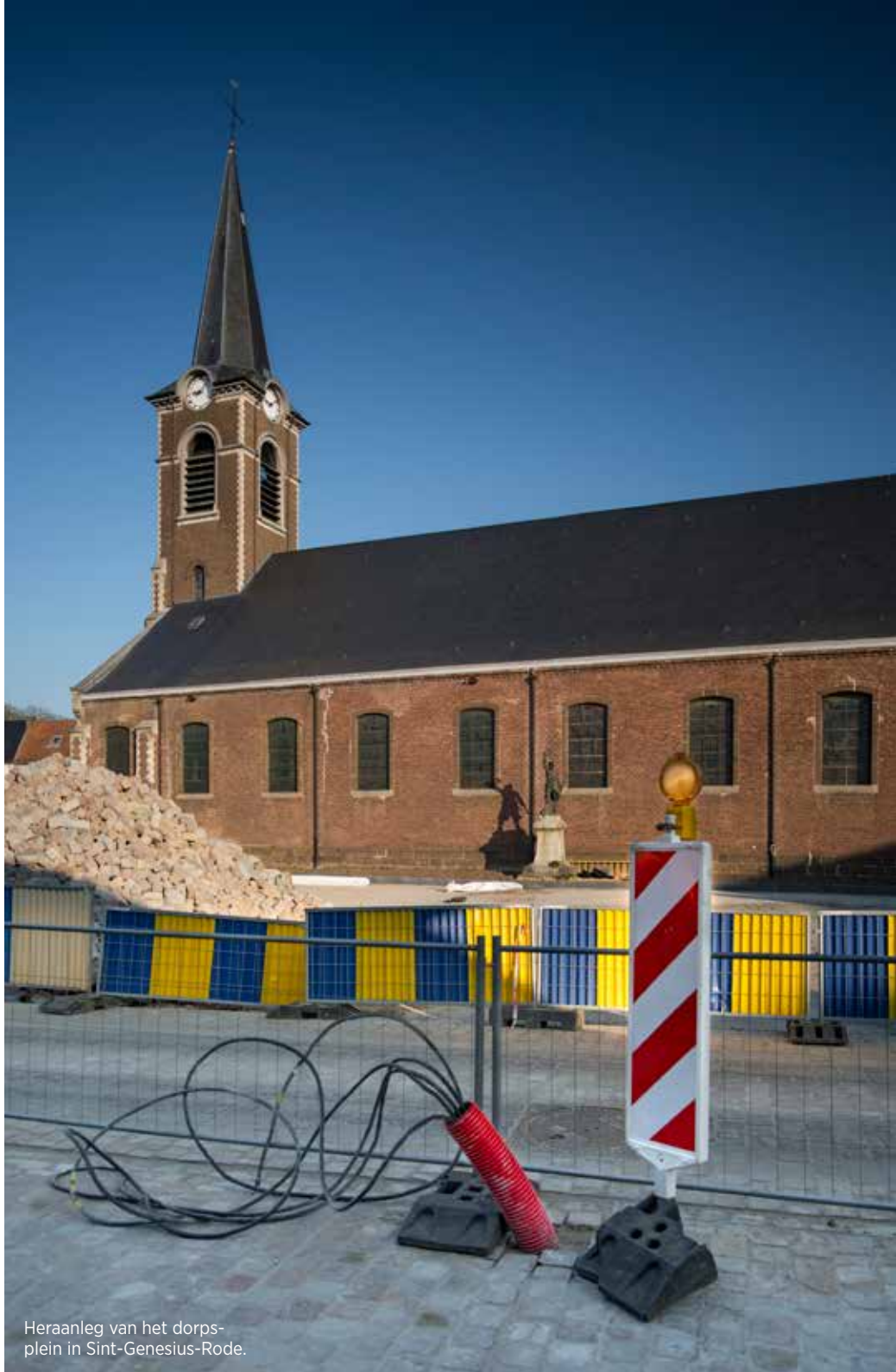
Heraanleg van het dorpsplein in Sint-Genesius-Rode.

Volgens het masterplan, dat gerealiseerd wordt tussen 2016 en 2020, worden een aantal straten in verschillende fases heraanlegd. Daarnaast is de uitbreiding van de gemeentelijke basisschool 't Villegastje en een nieuw administratief gebouw voor het OCMW, de bibliotheek en het Huis van het