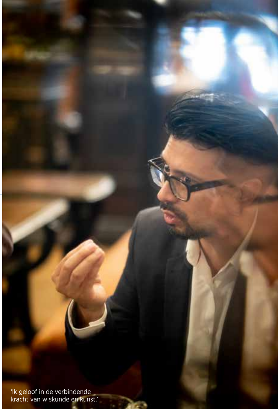
'Ik geloof in de verbindende kracht van wiskunde en kunst.'

Meersman: 'Dat is een interessant standpunt dat me aan het denken zet. Voor mij bestaat dé waarheid niet. Zelf pleit ik er heel erg voor om met elkaar in debat te gaan en goede argumenten aan te reiken zodat we elkaars waarheid beter kunnen begrijpen. Dat wiskunde en wetenschap ons van andere diersoorten onderscheiden en ons inzichten