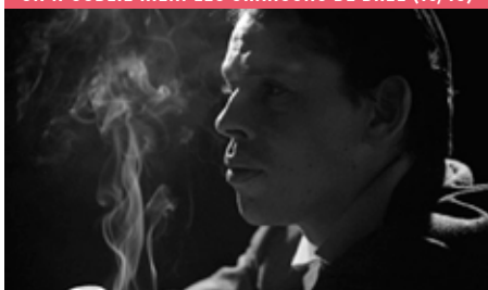
ON N'OUBLIE RIEN: LES CHANSONS DE BREL (13/10)