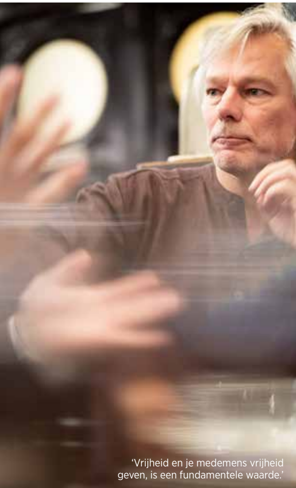
'Vrijheid en je medemens vrijheid geven, is een fundamentele waarde.'

Meersman: 'Ik zou het woord 'evolutie' naar voor willen schuiven. Daarmee bedoel ik 'als mens in een snel veranderende wereld evoluteren'. Zoiets als een persoonlijke renaissance. Voor mij betekent het jezelf opnieuw durven uitvinden en andere wegen durven inslaan. Het lijkt me een heilzame manier om verzuring of een burn-out voor te zijn.'