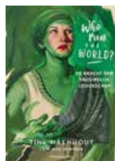
Who run the world?, Tine Maenhout i.s.m. Elke Jeurissen, Pelckmans Uitgevers, 244 pg.

om dingen aan te voelen en om een omgeving te creëren waarin iets kan groeien, om vertrouwen te geven, kennis te verwerven op basis van intuïtie en holistisch te kijken, na te gaan hoe alles met elkaar verbonden is. Dankzij masculiene eigenschappen gaan leiders makkelijk over tot actie, ze verleggen grenzen en nemen risico's. Het maakt dat ze kennis verwerven door analyse en het zoeken van causale verbanden en dat ze over het vermogen beschikken om te structureren. Tot nu toe hebben we in onze maatschappij, en zeker in het bedrijfsleven, heel erg de nadruk gelegd op het masculiene. Dus zowel mannen als vrouwen gaan die masculiene eigenschappen meer ontwikkelen en inzetten.' Mees heeft doorheen haar carrière gemerkt dat vrouwen onzeker kunnen