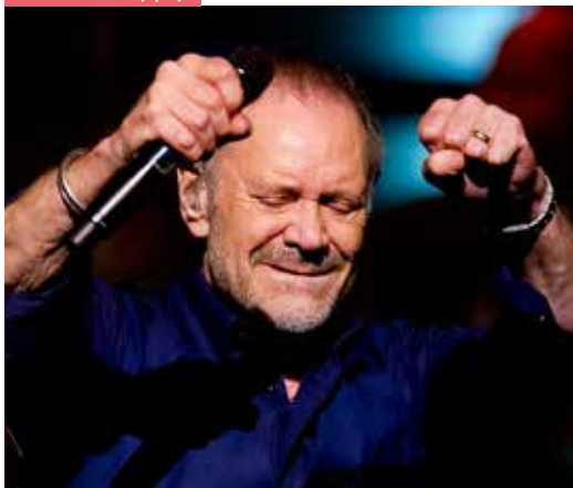
ROB DE NIJS (6/6)