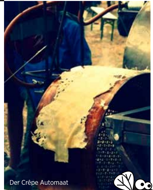
Der Crêpe Automaat

i 'Wie Is Guy?' wordt verdeeld door Universal. Zwangere Guy opent Rock Werchter op donderdag 28 juni en speelt op vrijdag 29 juni op Couleur Café. Zie ook www.rockwerchter.be en www.couleurcafe.be