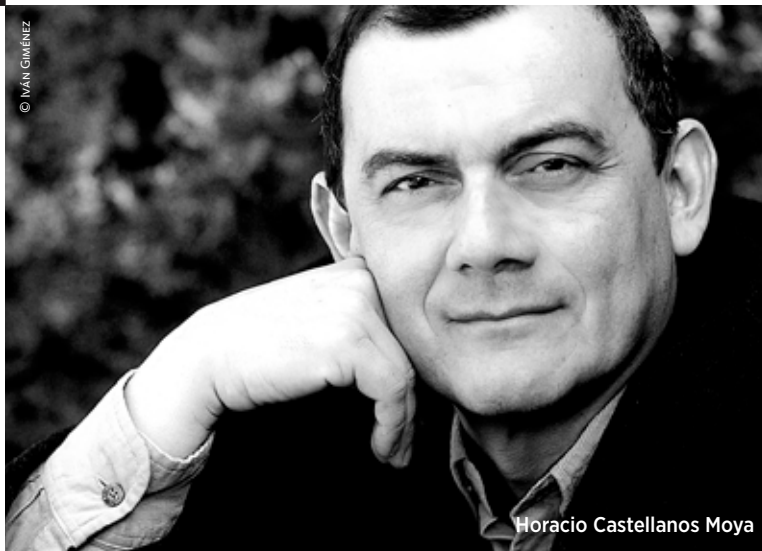
Horacio Castellanos Moya