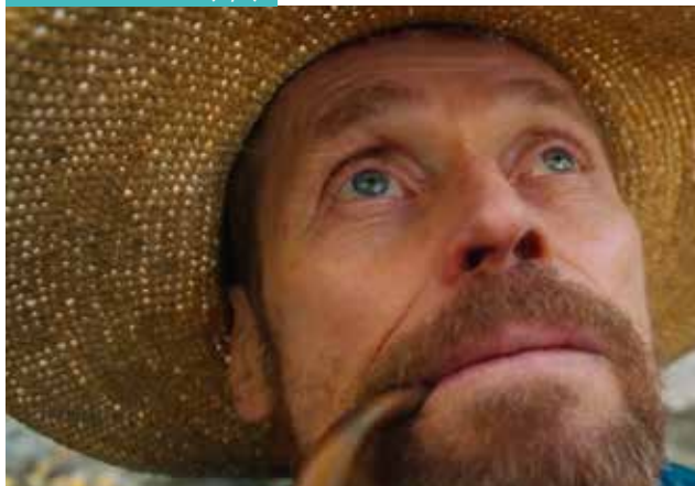
AT ETERNITY'S GATE (11/6)