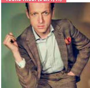
YOURS TRULY (8 EN 9/11)