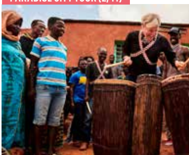
PARADISE CITY TOUR (2/11)