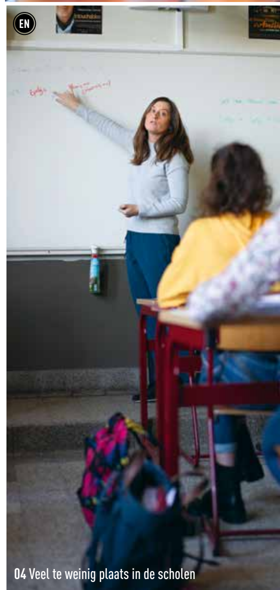
04 Veel te weinig plaats in de scholen

VERDELING RandKrant maart wordt bus-aan-bus verdeeld in Meise, Merchtem, Asse, Wemmel, Dilbeek, Sint-Pieters-Leeuw, Drogenbos, Linkebeek, Beersel en Sint-Genesius-Rode.