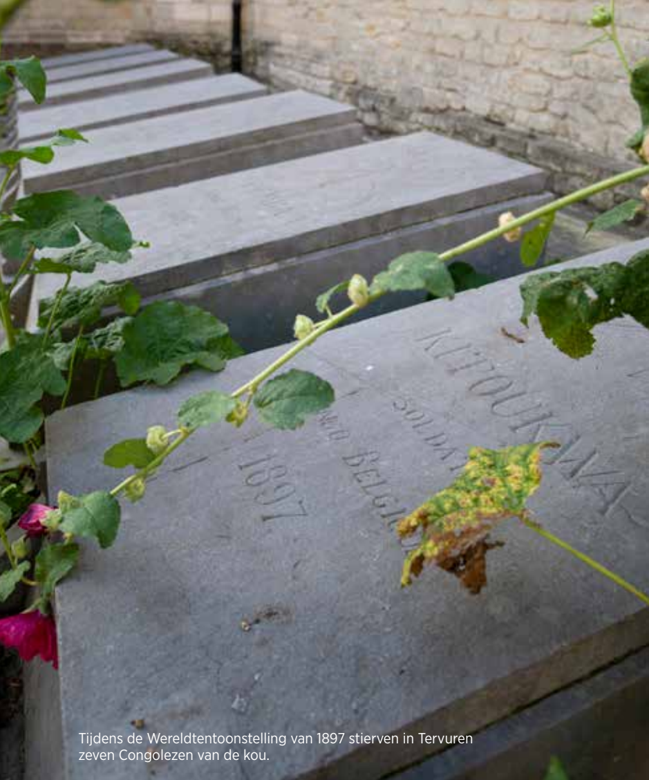
Tijdens de Wereldtentoonstelling van 1897 stierven in Tervuren zeven Congolezen van de kou.