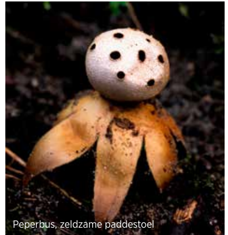
Peperbus, zeldzame paddestoel