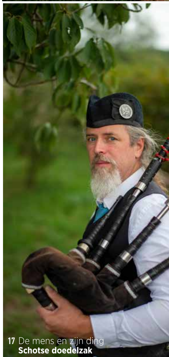
17 De mens en zijn ding Schotse doedelzak

VERDELING RandKrant oktober wordt bus-aan-bus verdeeld in Grimbergen, Vilvoorde, Machelen, Zaventem, Kraainem, Wezembeek-Oppem, Tervuren, Overijse en Hoeilaart.