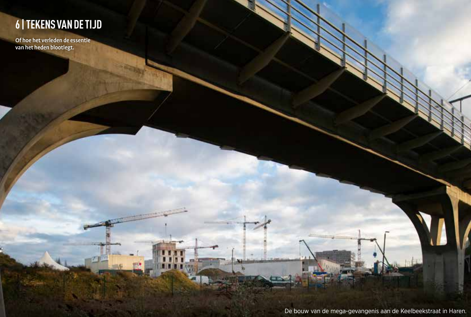
De bouw van de mega-gevangenis aan de Keelbeekstraat in Haren.