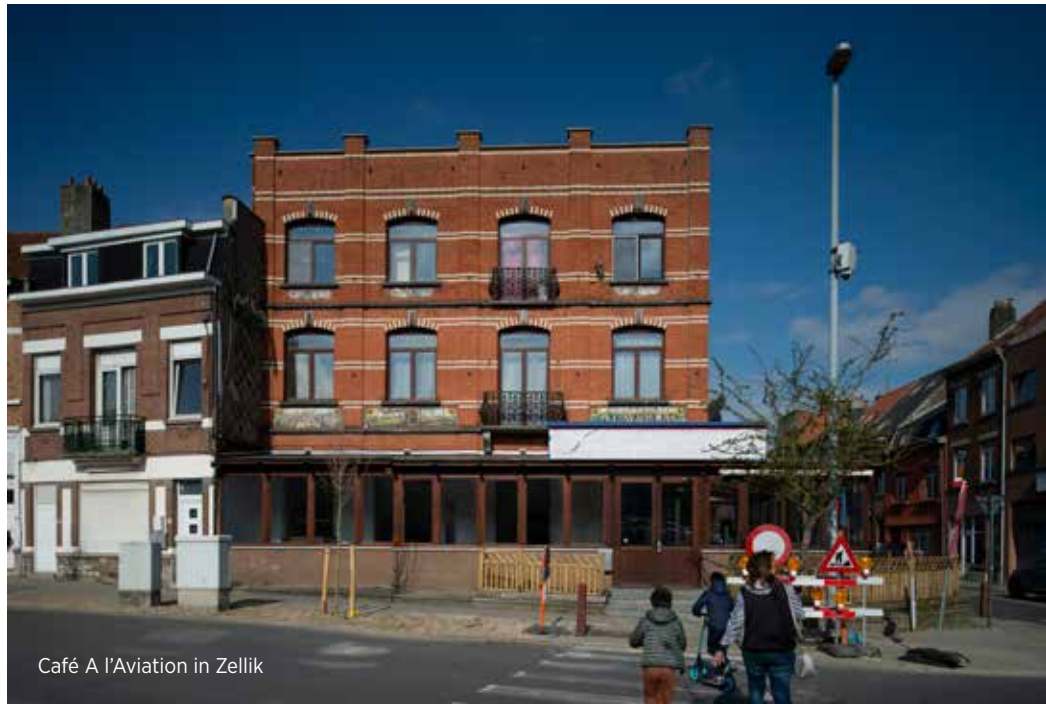
Café A l'Aviation in Zellik

Het vliegtuig was niet alleen een wapen geworden. Het ontwikkelde zich ook tot een primitief transportmiddel. Op de nieuwe militaire luchthaven van Evere, op de grens met Haren, kreeg kort na de oorlog de eerste echte commerciële passagiersdienst vorm. Al werd ze eerst gedoogd op het militaire terrein, toch zou het de burgerluchtvaart zijn die vanuit de Harense kant van het vliegveld de militaire luchtvaart steeds meer zou overvleugelen. En al gaf de militaire luchtvaart de aanzet, het waren vooral onze belangen in Congo die de stimulans gaven voor de ontwikkeling van