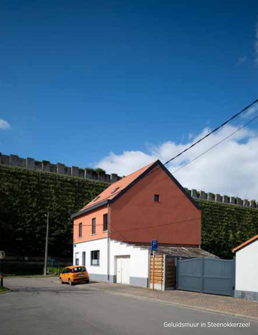
Geluidsmuur in Steenokkerzeel

► al werd Melsbroek voor het passagiersvervoer almaar belangrijker. Maar Melsbroek was slechts een tussenstap. De Wereldtentoonstelling van 1958 op de Heizel toonde de weg naar de toekomst, met het Atomium als symbool van de mogelijkheden die de nieuwe tijd te bieden had. Aan de oostkant van het luchthaventerrein verrees een ander baken: een gloednieuw luchthavengebouw verwelkomde de buitenlandse bezoekers in het naoorlogse België. Tegelijkertijd was het een teken voor de bewoners van ons land dat ook voor hen het vervoersmiddel van de 20e eeuw binnen handbereik lag. De architectuur van de skyhall was groots en lichtig met grote raampartijen met zicht op het vertrekkende en toekomstige vliegverkeer. Het naoorlogse België had een open blik naar de wereld. De ster van de Expo gidste ons land op weg. Vanaf dan was Zaventem het middelpunt van de passagiersluchtvaart voor Brussel en België. In Melsbroek nam het groeiende vrachtverkeer de open plek in die het passagiersvervoer er had achtergelaten. Voor de plezierluchtvaart waarmee het allemaal begon, was er na de oorlog enkel nog plaats in Grimbergen.