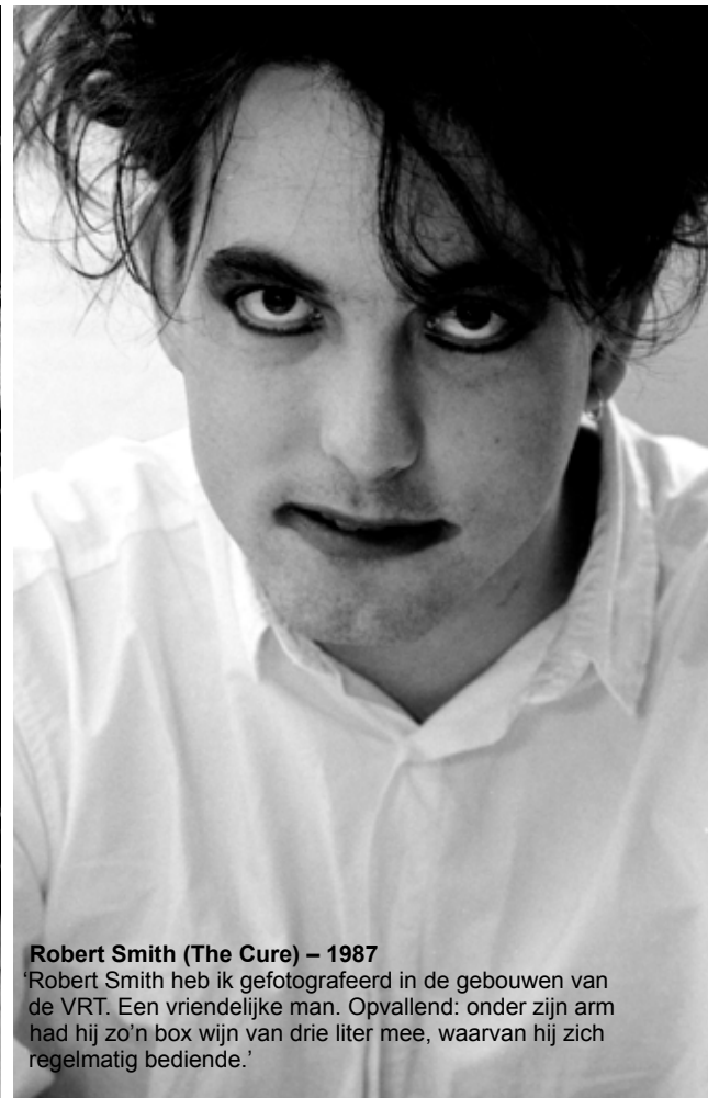
Robert Smith (The Cure) – 1987

'Cave ontmoette ik in hotel Astoria in Brussel. Het was middag en hij was al lichtjes dronken. We deden een wandeling door het hotel en hadden een tof gesprek.'