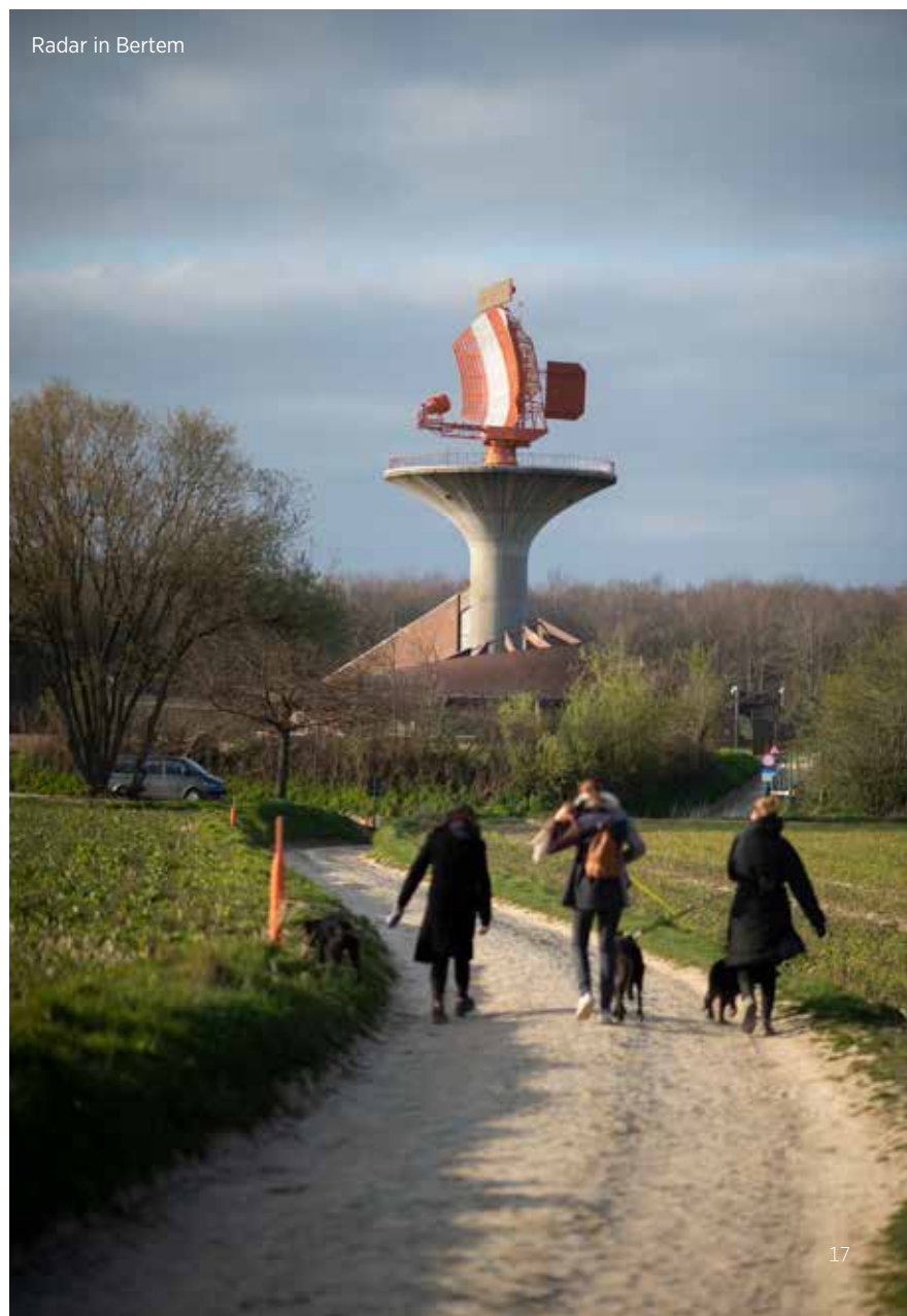
Radar in Bertem

l'Expo 58, tout devait bouger et avancer. Aujourd'hui, il est difficile d'imaginer la région sans l'aéroport. En 2019, il créa près de 24.000 emplois directs. Les attaques de 2016 et le virus du corona ont malheureusement compliqué les choses. Malgré un plan d'avenir, la croissance inconditionnelle du secteur de l'aviation semble également connaître des limites, comme le témoigne les restrictions imposées à d'autres grands aéroports tels que celui de Francfort.