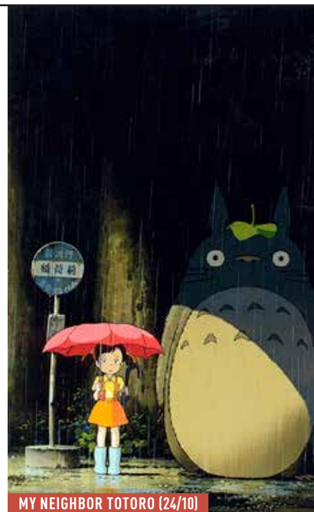
MY NEIGHBOR TOTORO (24/10)

De Frivole Framboos VR · 1 OKT · 20.30 Hoeilaart, GC Felix Sohie, 02 657 05 04 ZA · 9 OKT · 20.30 Asse, Oud Gasthuis, 02 456 01 60