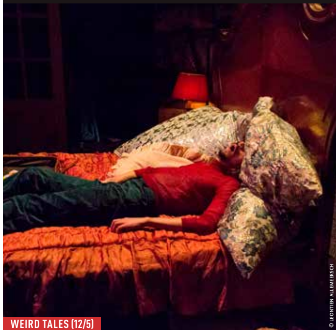
WEIRD TALES (12/5)