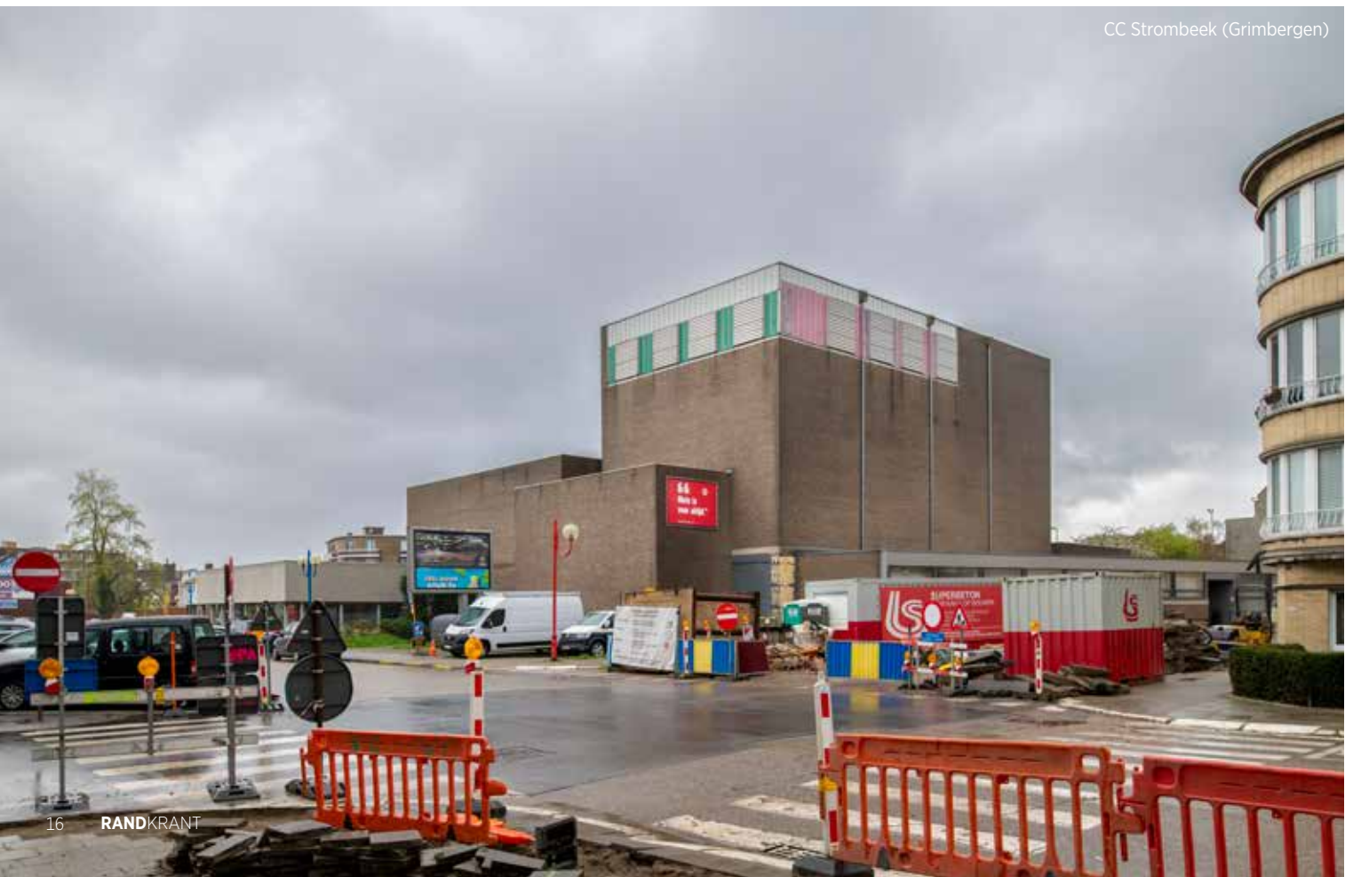
CC Strombeek (Grimbergen)