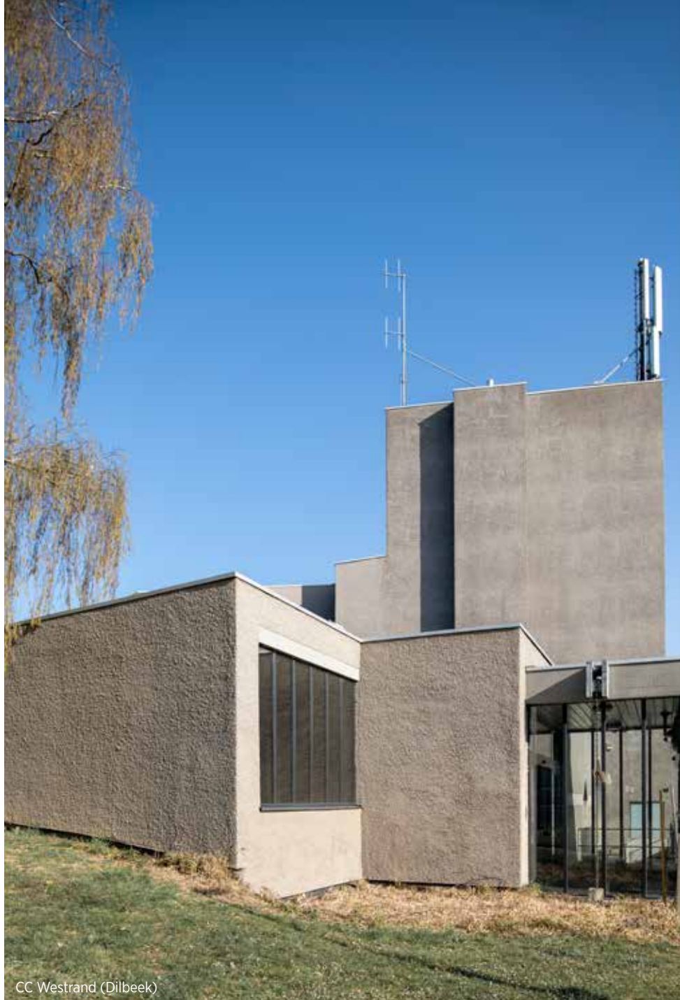
CC Westrand (Dilbeek)

Het culturele ontwakken van de Rand was ook