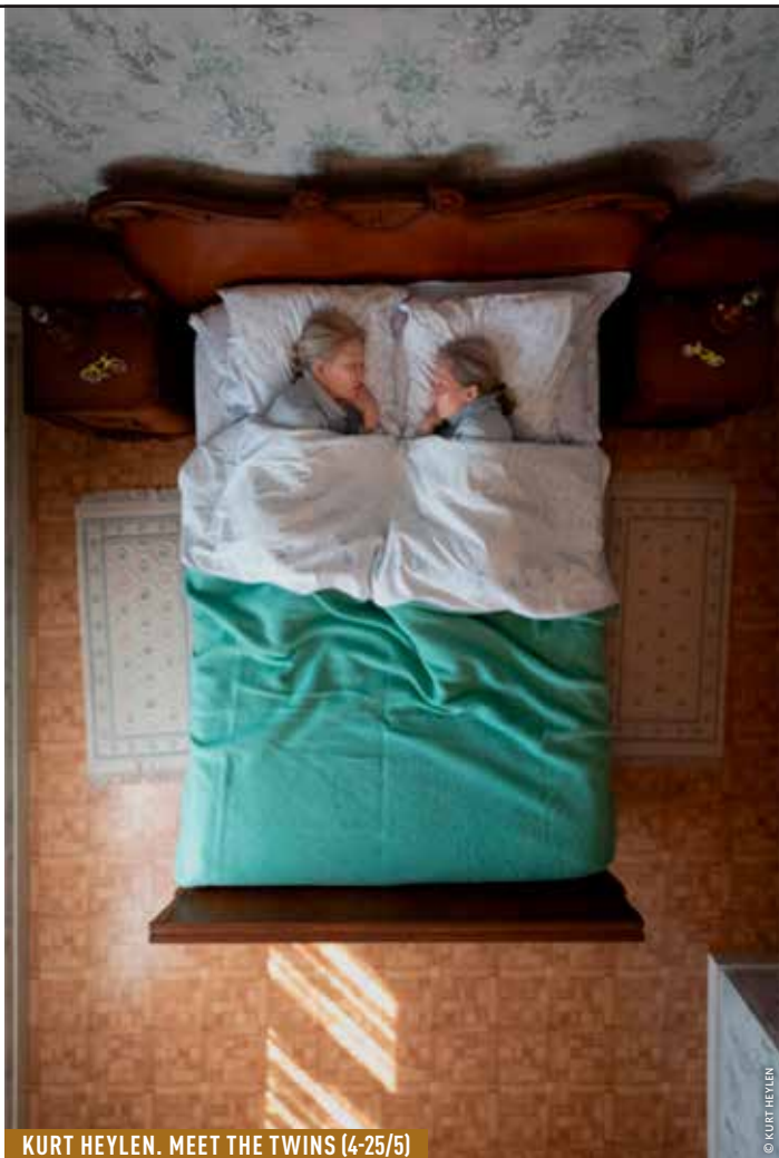
KURT HEYLEN. MEET THE TWINS (4-25/5)