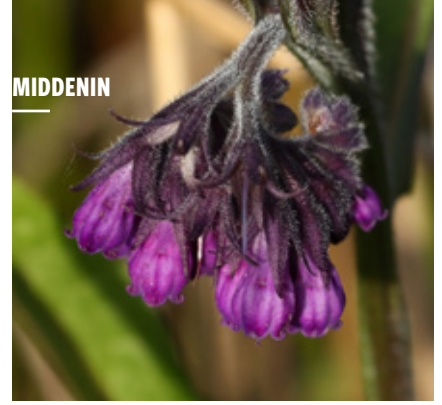
🕒 Gewone smeewortel