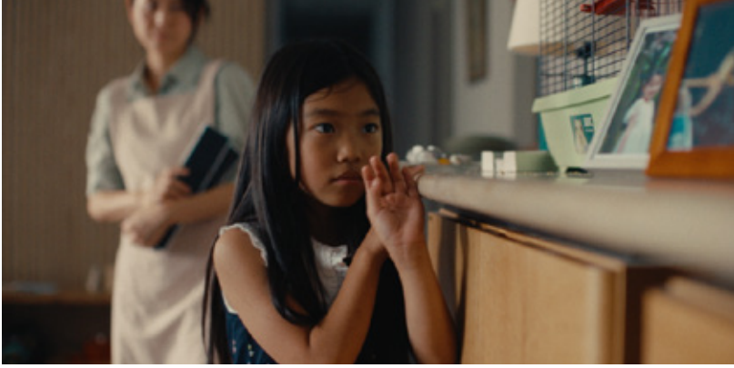
Soft Leaves (7/5, 26/5 en 27/5)