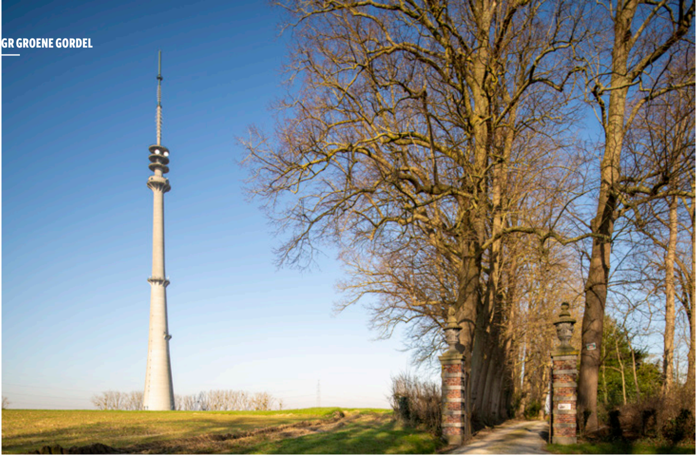
① De VRT-zendmast is een van de hoogste constructies in ons land.